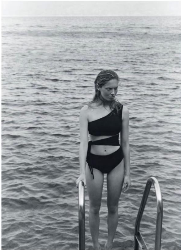
КУПАЛЬНИКЪ ПОЛИАМИДА И ЭЛАСТАНА, IRIS